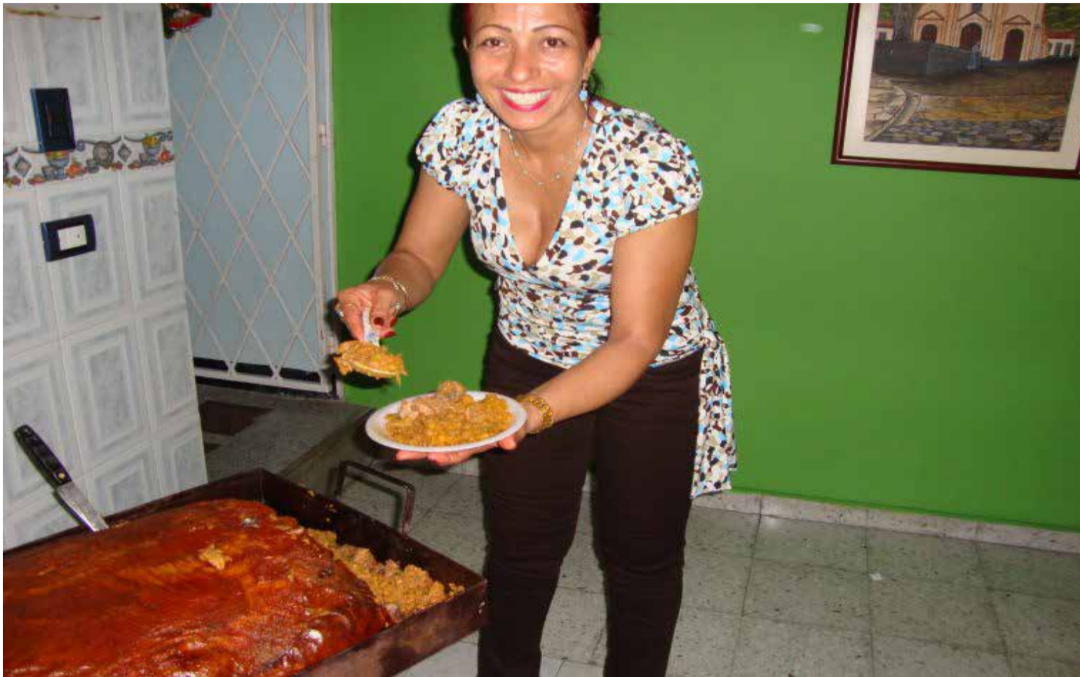
La lechona el plato típico del Tolima Grande