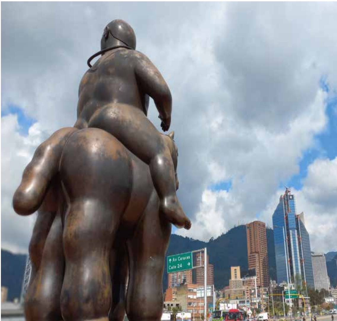
Obra de Botero observando el Centro Internacional de Bogotá.