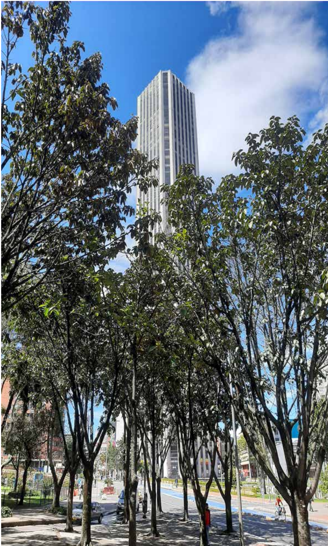
La emblemática torre de Colpatria, por muchos años fue el edificio más alto de Bogotá.

El Centro Internacional es uno de los sectores exclusivos de la capital, en este perímetro se encuentran edificios más altos de Colombia destinados a oficinas, como la torre Colpatria y el primer rascacielos de Colombia, el edificio Bacatá.