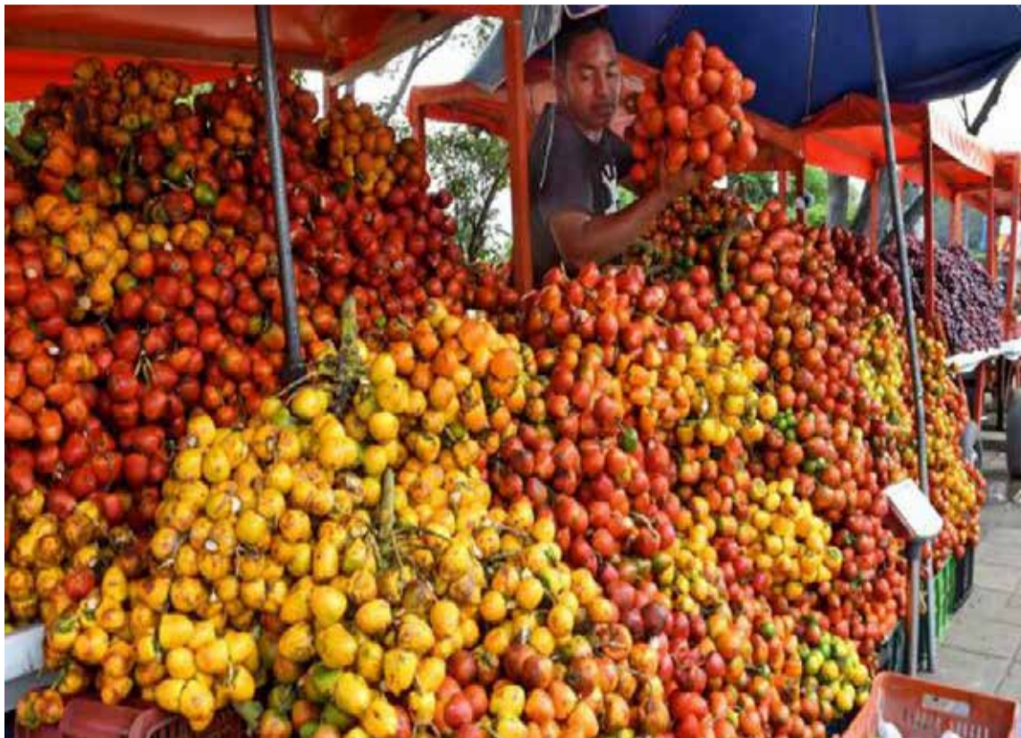
La exploración y valoración nutritiva de nuevas fuentes alimenticias para las granjas porcinas se debe a la baja competitividad de esta cadena.

En el caso del chontaduro, por cada tonelada producida se genera media tonelada de residuos, por lo que investigadores de la Universidad Nacional de Colombia (UNAL) Sede Manizales trabajan en un proceso para utilizar esos desperdicios en el desa-