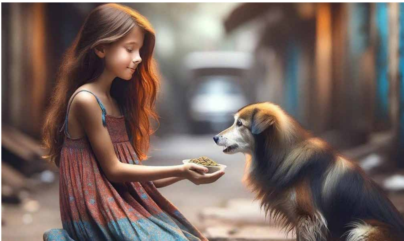
Gratitud con humildad

A lo largo de mi vida, he tenido el privilegio de convertir mis diferencias en mi mayor fortaleza. He aprendido que cada elemento de innovación, cada idea fuera de lo común me ofrece una mejor calidad de vida. Sin embargo, esto no sería posible si no hubiera desarrollado la capacidad de entender, incluso en