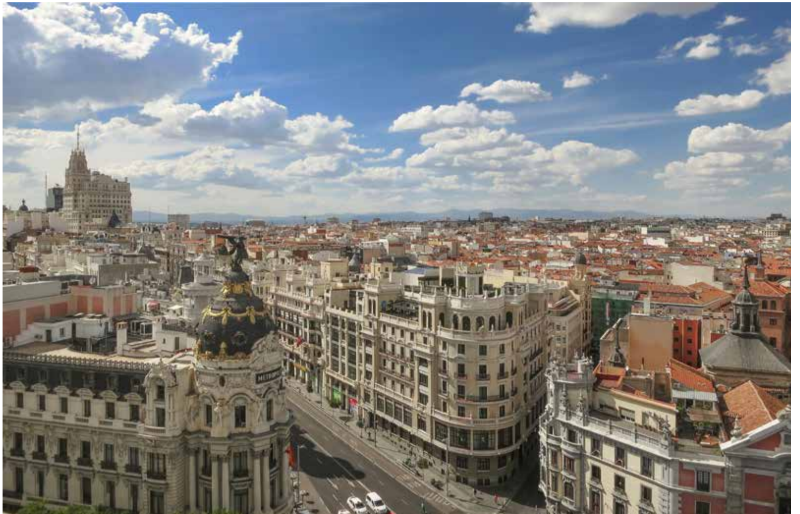
La Gran Vía en Madrid