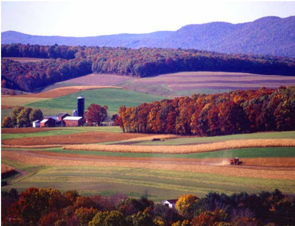
Naturaleza en todo su esplendor

T urismo de Naturaleza, sistemas productivos sostenibles, transición energética justa, reindustrialización, conservación y restauración de ecosistemas, y adaptación al cambio climático son los proyectos que se impulsarán con la puesta en marcha del Portafolio para la Transición Socioecológica de Colombia, una apuesta liderada por la ministra de Ambiente de Colombia, Susana Muhamad, que fue lanzada en la COP18 de cambio climático en Dubái el año pasado y que ha venido consolidándose este año con inversionistas del sector privado.