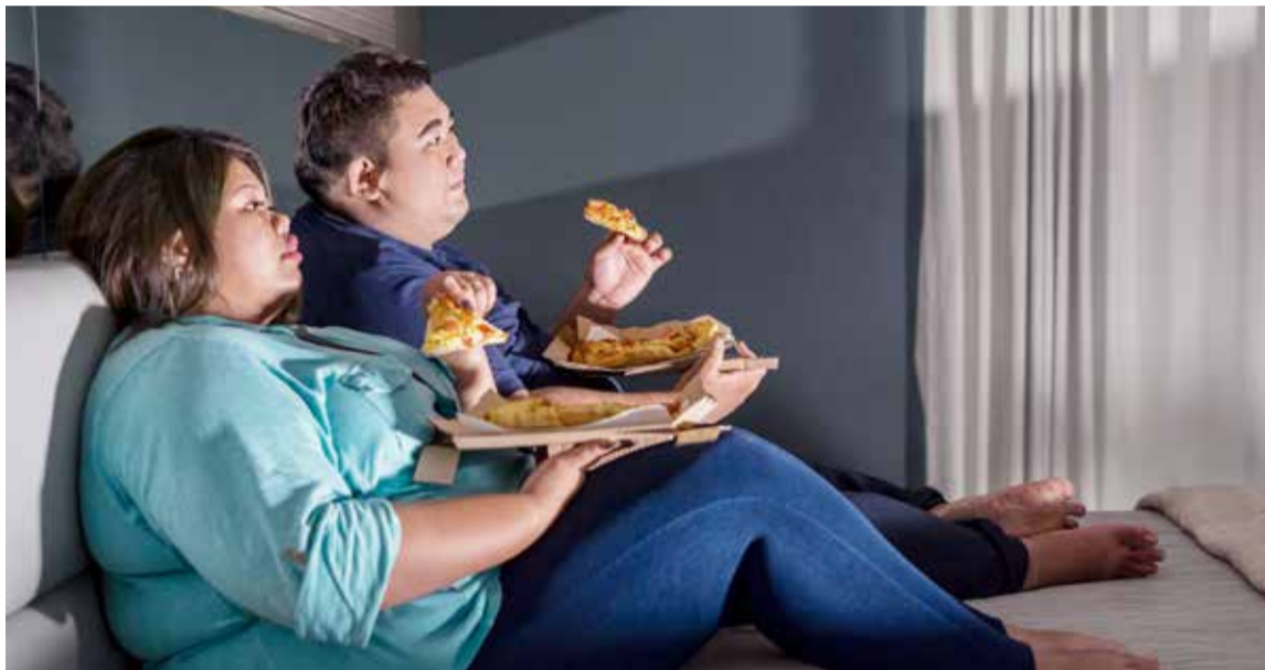
Obesidad la enfermedad del mundo.

La obesidad infantil se asocia con una mayor probabilidad de muerte prematura y discapacidad en la edad adulta. Sin embargo, además de estos riesgos futuros, los niños obesos sufren dificultades respiratorias, mayor riesgo de fracturas