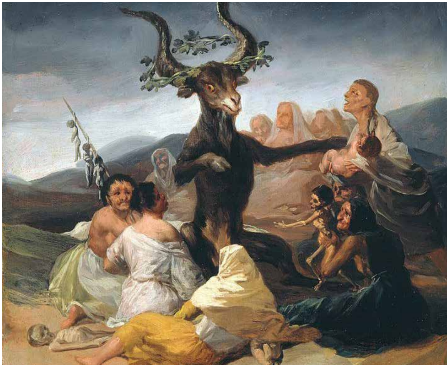
El aquelarre, obra de Goya. También el Museo Lázaro

Un monasterio, una basílica y os vamos ahora a hablar de una ermita, la de San Antonio de Florida, que forma también parte de los tesoros menos conocidos de Madrid. Este templo, famoso por su romería del 13 de junio, sorprende por el conjunto pictórico que Goya pintó a finales del siglo XVIII.