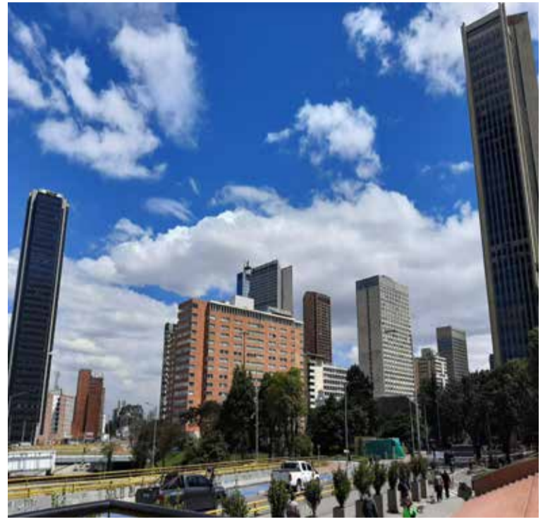
El núcleo del Centro Internacional.