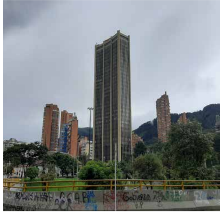
Edificios oficinas y vivienda