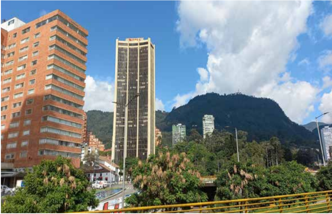
Al fondo el cerro de Monserrate