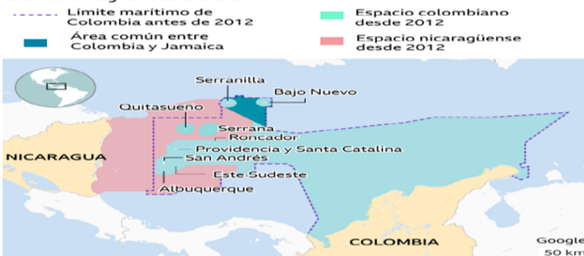
La pelea por el mar entre Colombia y Nicaragua

Así quedó la delimitación tras la resolución de la Haya en 2012