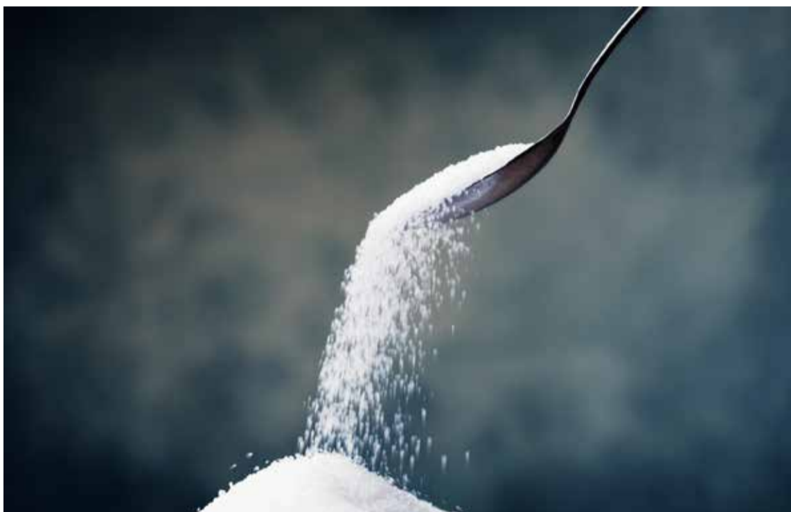
El azúcar es ocho veces más adictiva que la cocaína

Frente al consumo de gaseosas y otros refrescos, indicó que «el consumo de bebidas azucaradas aporta 220 a 400 calorías extra en el día, lo que se