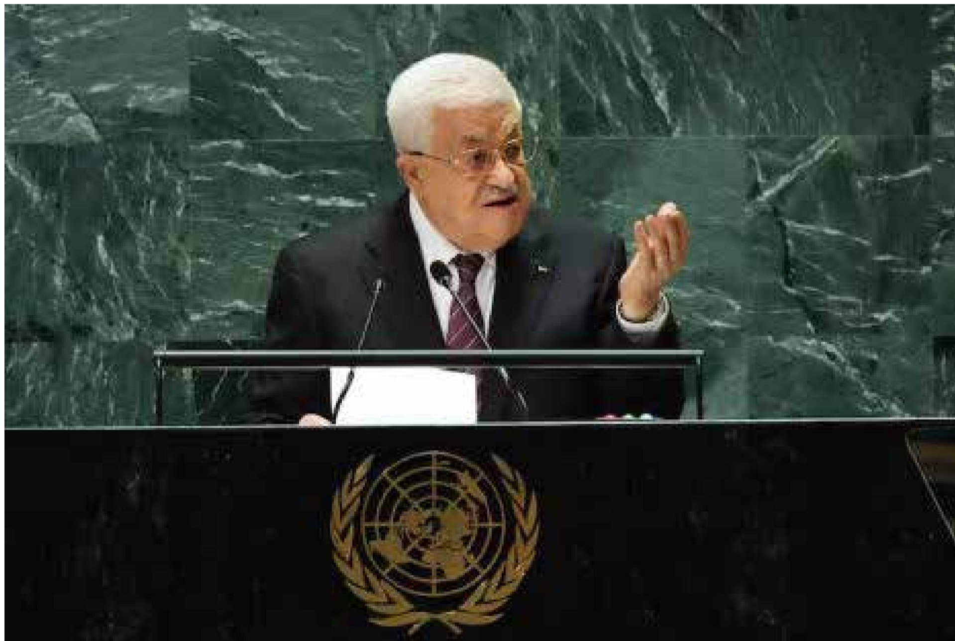
El presidente palestino Mahmud Abás, ante las Naciones Unidas